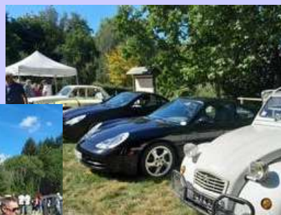
Expo de voitures anciennes

Nous nous efforçons de procéder au mieux suivant les impératifs de chacun. N'hésitez pas à nous faire part de vos difficultés.