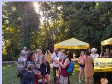
Pot de la Mairie