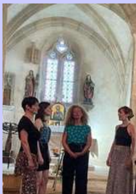
Concert à l'église